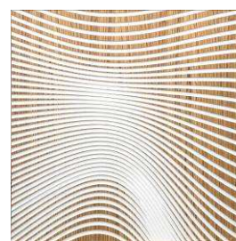
Zen Wave Hybrid Zébrano