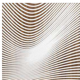
Zen Wave Hybrid Noyer US

Ce prix, nouvelle reconnaissance d'un savoir-faire unique, confirme le positionnement luxe et design de MAROTTE ; il contribue à renforcer la notoriété du groupe OBER sur le marché américain ouvrant ainsi de nouvelles perspectives dans le marché de la décoration intérieure haut de gamme outre-Atlantique.